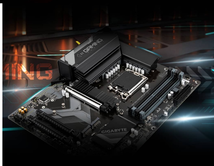
GIGABYTE B760 GAMING X DDR4