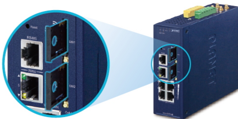
Dual 5G NR