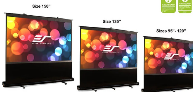
Black masking borders on all sides enhances picture contrast and absorbs minor projector overshoot

Free-Standing Portable Pull-up Projector Screen