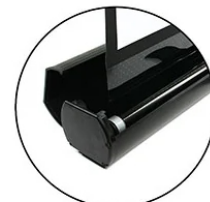
Heavy-duty aluminum case