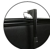
Telescoping support for variable height settings (x2 for 150" models)