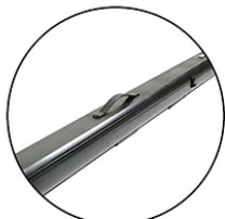
Built-in Carrying Handle for enhanced mobility