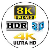
4K/8K Ultra HD, Active 3D, and HDR ready